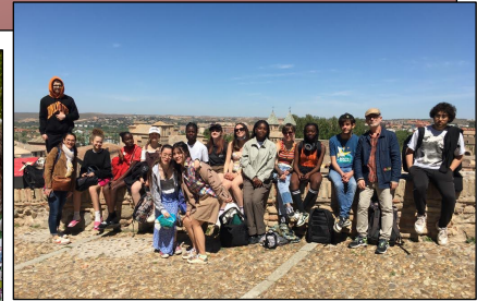
Les 14 élèves français en Espagne (Plaza de Toros de Daimiel, Almagro, Tolède, lycée Ojos del Guadiana pour une dégustation de churros, les moulins de Consuegra rendus célèbres par le Quichotte de Cervantès...).