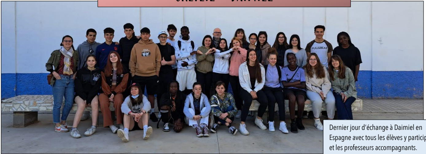
Dernier jour d'échange à Daimiel en Espagne avec tous les élèves y participant et les professeurs accompagnants.